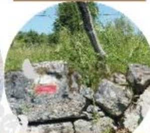
TRAVESSIA DO ALVÃO