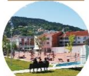
PRAÇA JOÃO PAULO II VILA POUCA DE AGUIAR