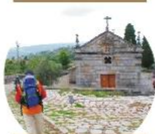
IGREJA DE SANTA EULÁLIA