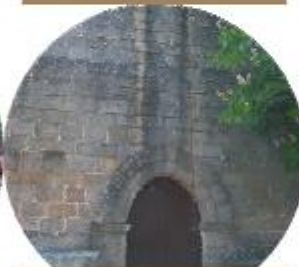
IGREJA ROMÂNICA DE S. MIGUEL