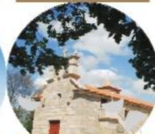
IGREJA DE BARENHO