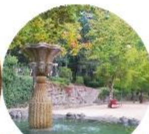
PARQUE TERMAL DE PEDRAS SALGADAS