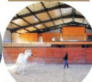
CENTRO HÍPICO DE PEDRAS SALGADAS