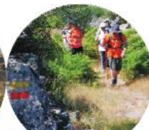
CAMINHO PORTUGUES INTERIOR DE SANTIAGO