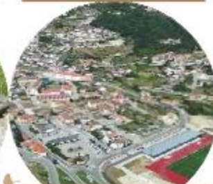
VILA POUCA DE AGUIAR