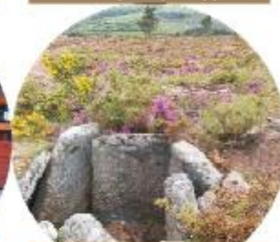
MAMOÁ DO ALTO COTORINO ALVÃO