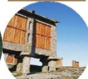
ALTO DOS CANASTROS