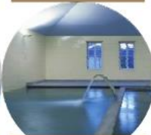
SPA DE PEDRAS SALGADAS