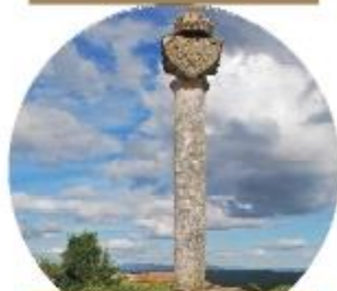
PELOURINHO DE ALFARELA