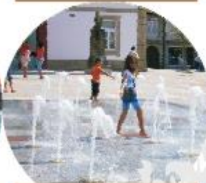
PRAÇA LUIS DE CAMOES VILA POUCA DE AGUIAR