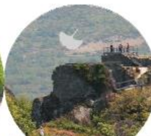
CASTELO DE AGUIAR